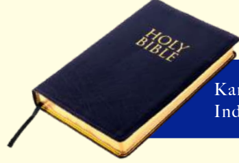
Kannada Bible Indian Version